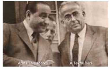
Adnan Menderes